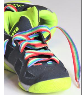
Abbeelding 3. Regenboogveters als symbool van homoacceptatie in de sport.

De definities van seksuele integriteit bevatten zelfintegratie, seksuele onschendbaarheid en een positieve en mensenrechten benadering van seksualiteit en seksuele relaties. Van de 486 artikelen die voldeden aan de inclusiecriteria voor deel 2, bleven 28 relevante artikelen over. Operationalisaties van seksuele integriteit in de sport zien we in onder meer: reflecteren op en bespreekbaar maken van kwesties rond seksuele integriteit -zoals aanraken, seksuele en gendernormen, seksueel gedrag en relaties-, handelen in belang van de sporter en adequaat reageren bij seksueel grensoverschrijdend gedrag.